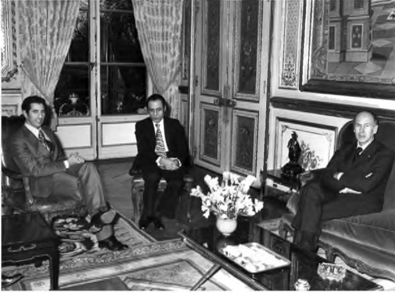
جانب من لقاء بين عبد السلام جلود والرئيس الفرنسي فاليري جيسكار ديستان، فرنسا، 1976.